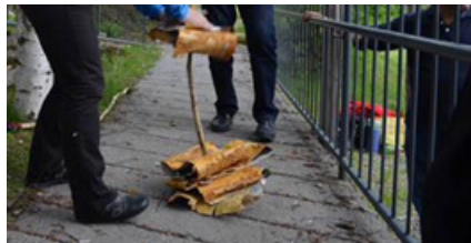
Falla tradicional amb escorça de beç

L'estratègia a seguir pretén que els propietaris dels beços se sentin com a part important i insubstituïble del projecte, tenint en compte la seva presumpta proximitat i arrelament a les tradicions centenàries del país. Cada cop que es crema una falla tradicional, cal que el sentit d'apropiació de la festa per part de la comunitat en general sigui autèntica, emotiva i compromesa.