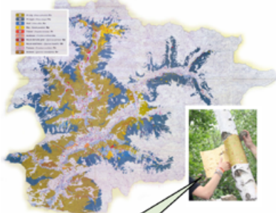
AFAY 0001. Inventari per mitjà de plaques numerades col·locades als beços. Aquest nombre i localització georeferenciada ha de servir per fer el seguiment administratiu i mediàtic.

L'escorça del bedoll és l'element principal de la cremada de falles tradicional. Cal reconèixer la seva fragilitat com a recurs i la poca acceptació per part de la societat actual, en relació a l'afectació visual que representa la retirada de l'escorça.